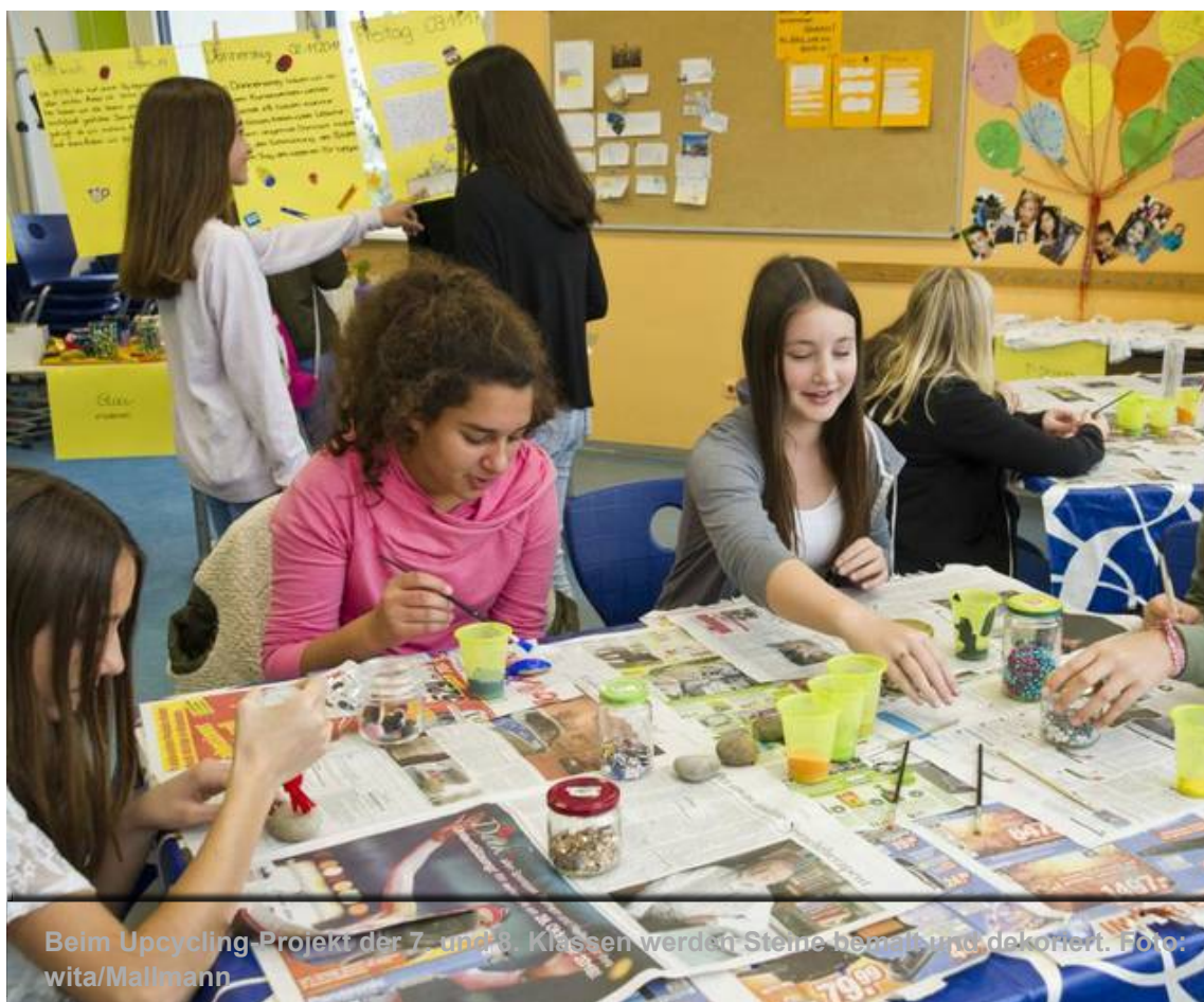
Beim Upcycling-Projekt der 7- und 8. Klassen werden Steine bemalt und dekoriert.