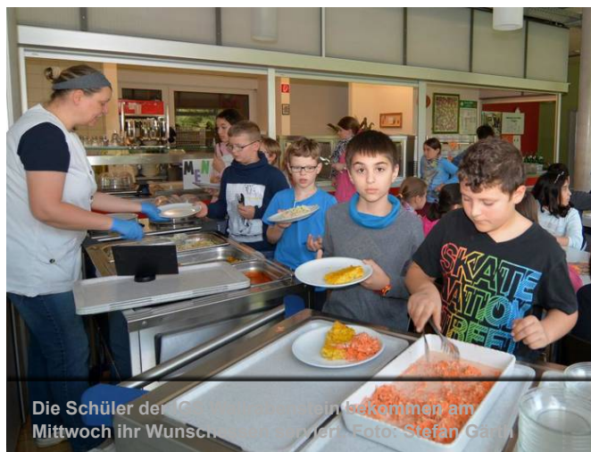
Die Schüler der Gesamtschule Wallrabenstein bekommen am Mittwoch ihr Wunschessen.