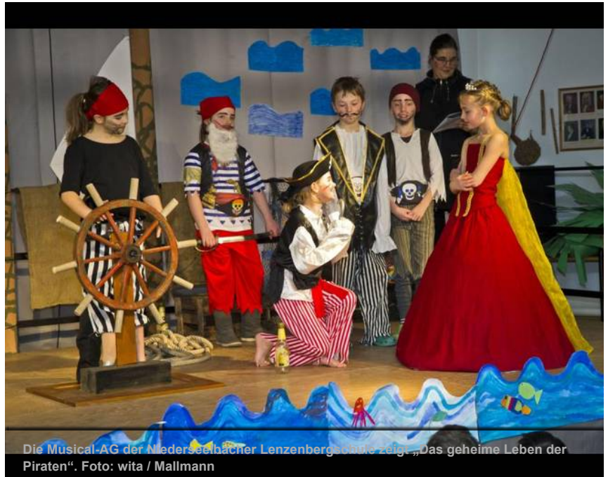
Die Musical-AG der Niederseelbacher Lenzenbergschule zeigt „Das geheime Leben der Piraten“.